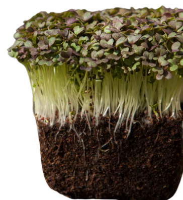
MOUTARDE ROUGE FRISÉE

un goût vif, poivré et légèrement épicé, rappelant le radis mûre.